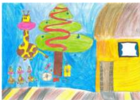
(Agáta Podlahová, 7. B)