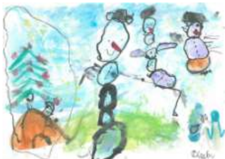
(Martin Písek, 7. A)