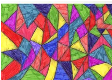
(Lenka Raabová, 9. A)