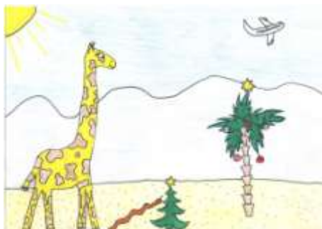
(Anita Friihaufová, 7. B)