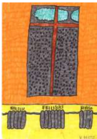
(Vojtěch Motz, 6. C)