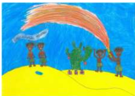
(Karolína Hrubá, 7. B)