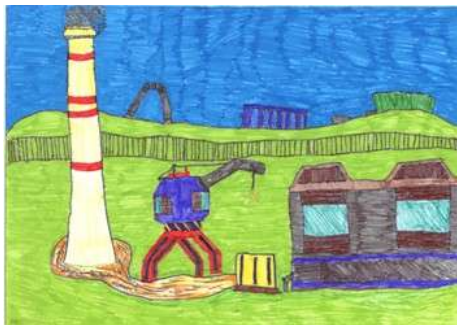
(Matyáš Perek, 6. C)