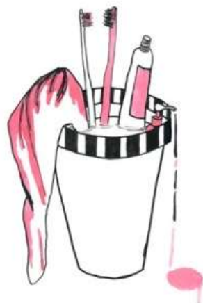
(Šimon Perek, 9. B)