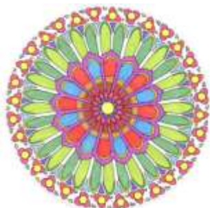
(Olga Litiuc, 8. A)