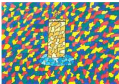
(Irena Tomková, 9. A)