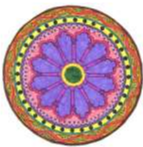
(Radka Machová, 8. A)