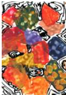
Zuzana Vávrová, 6. B