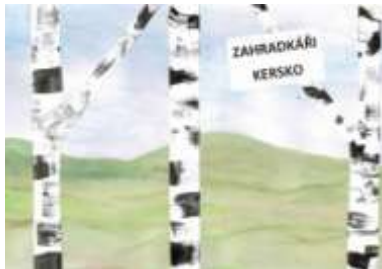
Martin Písek, 9. A

Po projížďce koně odstrojíme a ustájíme sedlo, ohlávku, popřípadě žebatku a bandáže uklidíme na určené místo. Kůň potřebuje pořád čistou podestýlku, takže vezmeme lopatu, vidle a začneme. S chutí do toho a půl je hotovo. Kůň je vykydán, ale má hlad, vodu nabere do připraveného koryta. K jídlu mu dáme zrní, seno, popřípadě ovoce a zeleninu. Nakonec můžeme koně vypustit na pastvu.