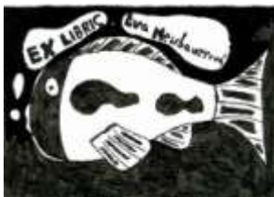
Eva Neubauerová, 7. B