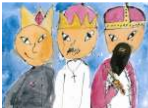
Ondřej Čapek, 3. A