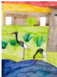
Vojtěch Kolář, 6. C