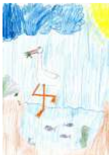
Ondřej Novák, 4. B