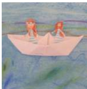
Žáci 3. A