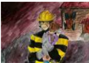
Lucie Rybianská, 7. B