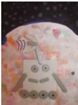
Žáci 3. A