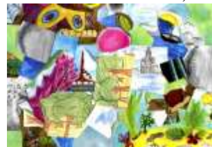
Lucie Rybianská, 7. B