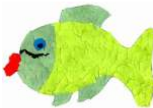
Žaneta Oláhová, 7. B