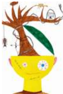
Vojtěch Kolář, 6. C