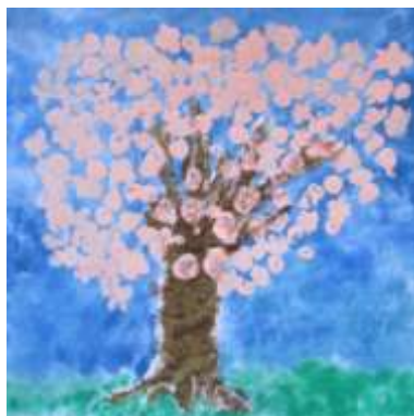
Žáci 3. A