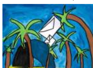
Patrik Gábor, 6. C