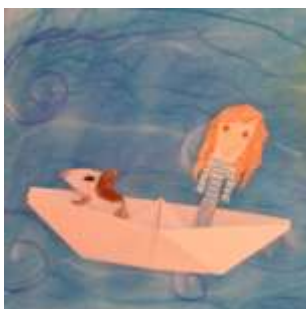
Žáci 3. A