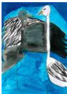
Edita Pohlodková, 6. C