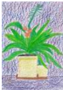
Kamila Punáková, 7. B