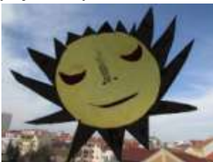
Žáci 3. A