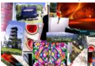
Natálie Silovská, 7. B