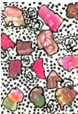
Tereza Pýchová, 6. B