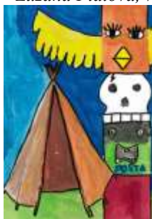
Hönig Matěj, 6. C