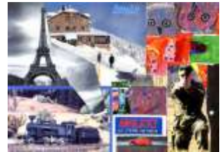
Milada Švecová, 7. B