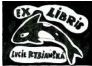
Lucie Rybianská, 7. B