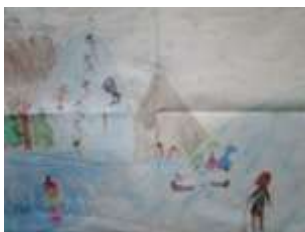
Žáci 3. A