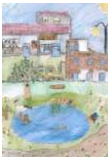
Matěj Vazač, 6. B