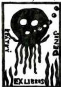
Viktorie Machaloušová, 9. C