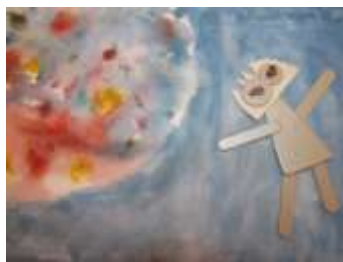
Žáci 3. A