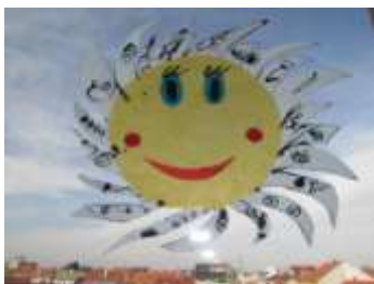
Žáci 3. A

Ferda jednou obědval a z guláše mu vyletěla moucha. Rozhodl se, že ji chytí. A tak běžel a běžel, až doběhl k tělocvičně, ale tam ho nechtěli pustit, když není přihlášen na kurz cvičení. Nejkratší doba přihlášení byla půl roku. Ferda chvíli přemýšlel, ale mouchu chtěl chytit a tak se přihlásil. V tělocvičně mu moucha uletěla na horní žebřinu. Začal lézt, ale z prostřední žebřiny spadl. Moucha mezitím sletěla přímo pod žebřiny a tak Ferda mouchu zabil při dopadu čelem.