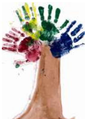
Lukáš Pešek, 2. A