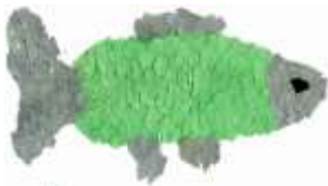
Vojtěch Kirschner, 7. B