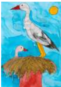
Eva Neubauerová, 7. B