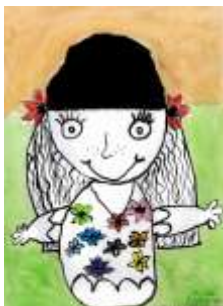
Kristýna Bulanová, 3. C