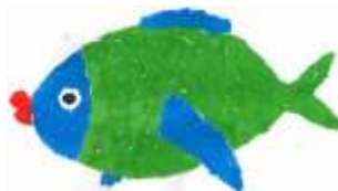
Kateřina Lavičková, 7. B