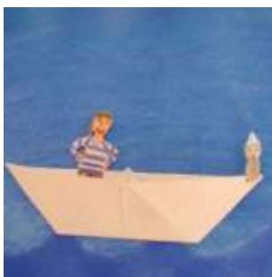
Žáci 3. A