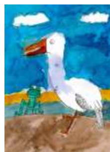
Jiří Mudrik, 7. B