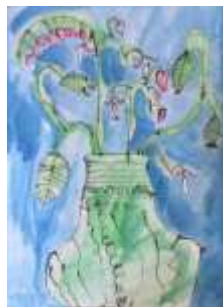
Mikuláš Paleček, 3. A