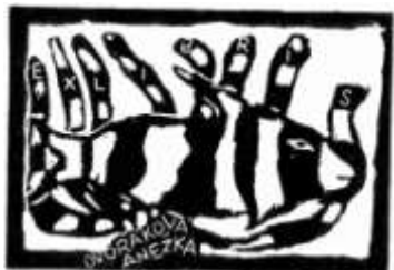
Anežka Dvořáková, 8. B