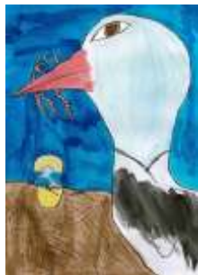
Žaneta Oláhová, 7. B