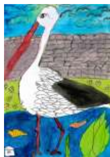
Kamila Punáková, 7. B