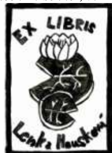
Lenka Housková, 9. C