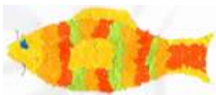
Dominika Karafízievová, 7. B