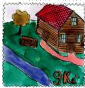
Ondřej Sýkora, 9. C