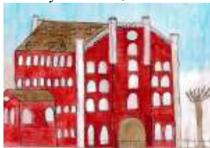
Kristýna Somolová, 8. B