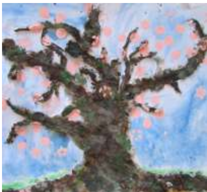
Žáci 3. A