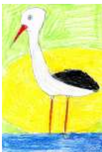
Adéla Pistorová, 4. B