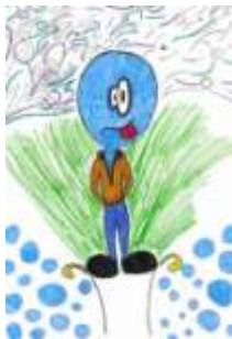
Eliška Maturová, 9. B