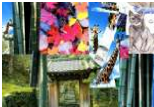
Emil Bendík, 7. B