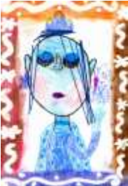
Barbora Váňová, 3. A