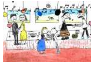
Barbora Poustevníková, 6. A