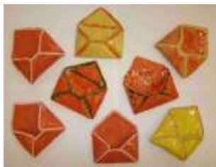
Keramika, 8. A + B