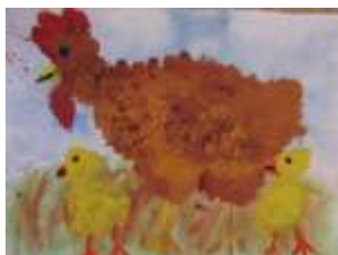
Žáci 3. A vzpomínají na Velikonoce