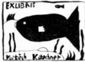
Vojtěch Kirschner, 7. B