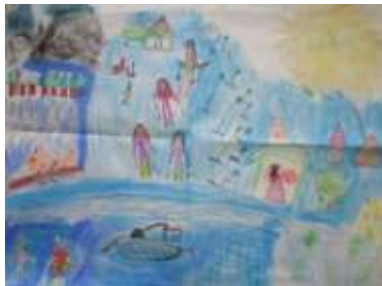
Žáci 3. A