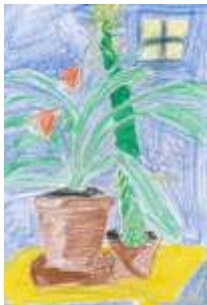
Cyril Pohlodko, 7. B