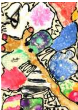
Nikola Uhrová, 6. B