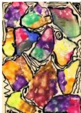
Sára Lavičková, 6. B